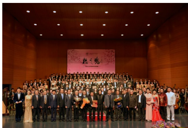
清唱剧《樱之魂》首演在金州新区大剧院完美盛放,300余大艺师生倾情演绎

● 音乐表演(乐器演奏):本专业方向培养德、智、体、美全面发展的,具备音乐表演(乐器演奏)方面的基本知识和专业技能,能在文艺表演团体、文化馆站、艺术院校、中小学从事乐器演奏和专业教学等工作的应用型、复合型人才。