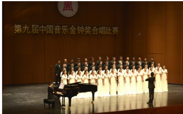
学院合唱团多次代表大连市、辽宁省参加全国“青歌赛”“金钟奖”等大型比赛，并取得骄人成绩

专业主干课程：基本功训练、中国民族民间舞、素质技巧、身韵、中外舞蹈史、舞蹈概论、舞蹈编导、教学剧目、舞蹈教法等。