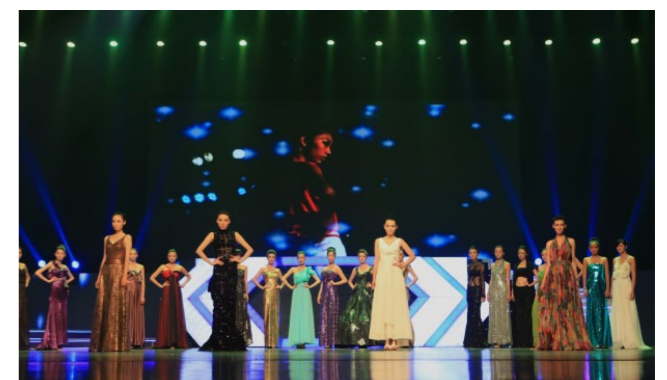
学生在历届“全国高等院校服装类专业教学成果展示”活动中获服装设计、服装表演和化妆造型比赛20余项大奖