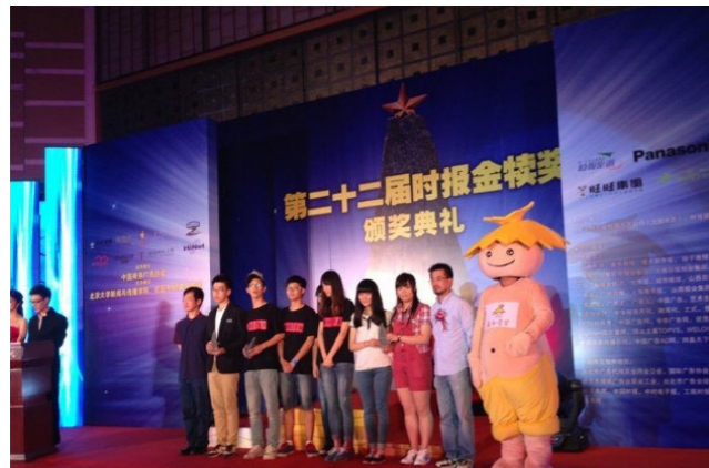
▶ 学生在全中国地区规模最大的学生广告活动“金楼奖”比赛中获铜奖