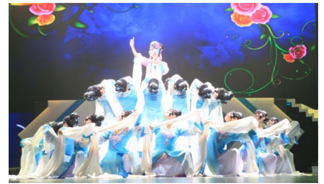
学院原创作品《戏梦人生》在第十届全国“桃李杯”舞蹈比赛中获表演二等奖和原创教学剧目二等奖，在辽宁省“荷花杯”舞蹈大赛中获金奖第一名，该舞蹈登上央视《我要上春晚》舞台