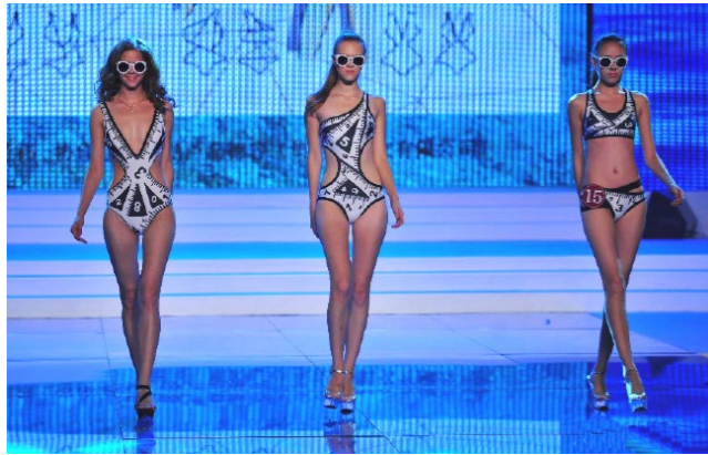
▶ 学生设计作品在第三届中国泳装设计大赛中荣获金奖