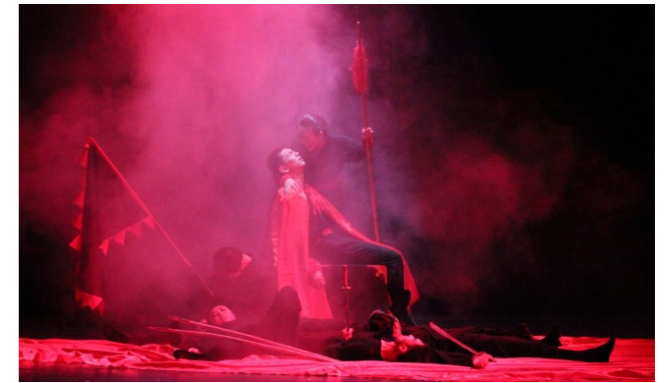
学院原创肢体话剧《杨门女将》在第三届中国校园戏剧节上获得优秀组织奖、优秀剧目奖和专业组唯一的优秀导演奖

专业主干课程：动画概论、动画造型设计、动画速写、风景写生、动画场景设计、动画运动规律、动画导演基础、摄影、卡通雕塑、漫画基础、定格动画、网络动画、动画短片实践、影视后期等。