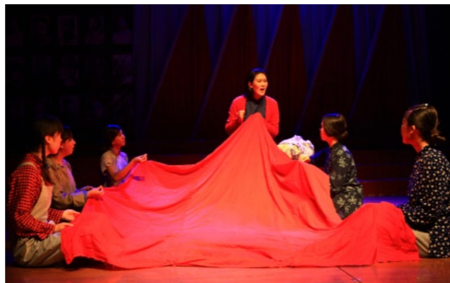
大型情景话剧《党的儿女》深入各机关、社区、学校和部队为五千余名观众演出

专业主干课程：基本功训练、民间舞、舞蹈编导、导演与排练、剧目分析、曲式分析、舞美与灯光、舞蹈编导学、舞蹈作品赏析等。