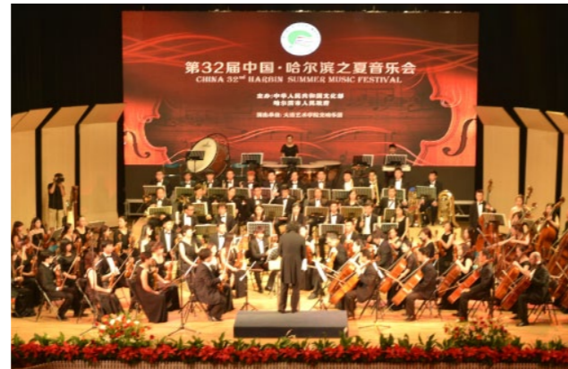
学院交响乐团在“第32届中国·哈尔滨之夏音乐会”演出轰动冰城，受到高度赞扬

专业主干课程：视唱练耳、基本乐理、和声学基础、曲式与作品分析、复调基础、音乐与动作、合唱与指挥基础、柯达依体系的视唱练耳、弹唱、钢琴伴奏艺术、音乐教学法等。