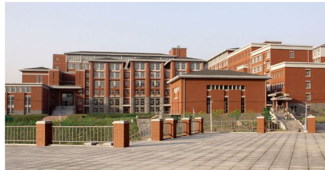
▶ 影视学院、传媒学院