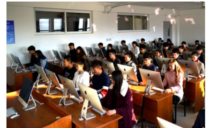
▶ 现代化的教学设施为学生提供了优良的学习条件