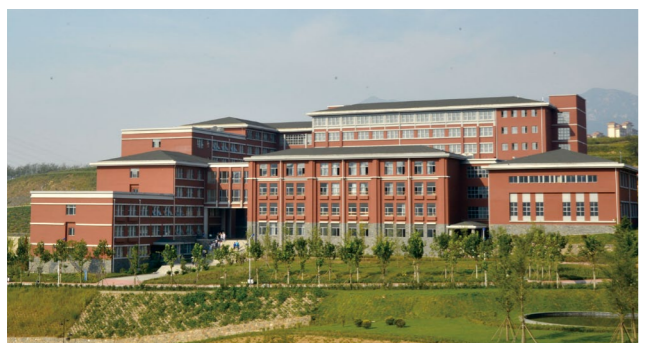
▶ 综合教学楼（文化艺术管理学院、基础教学部）