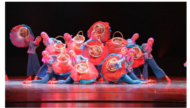
学院原创作品《赶海乐》在第九届全国“桃李杯”舞蹈比赛中获表演二等奖、剧目三等奖