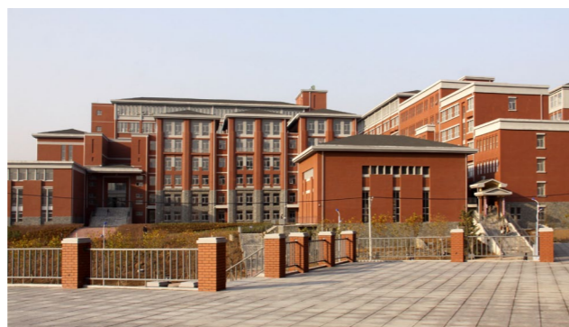
▶ 影视学院和传媒学院