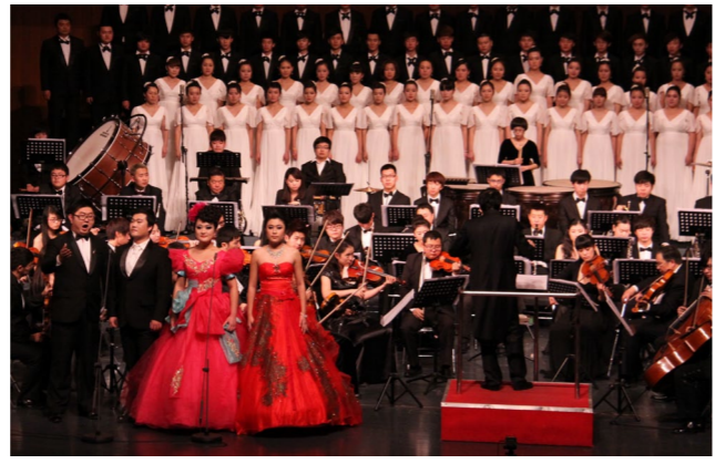
学院举办的四季音乐会成为当地政府“文化惠民工程”的重要组成部分

专业主干课程 基本功训练、中国民族民间舞、素质技巧、身韵、中外舞蹈史、舞蹈概论、舞蹈编导、剧目排练、舞蹈教法等。