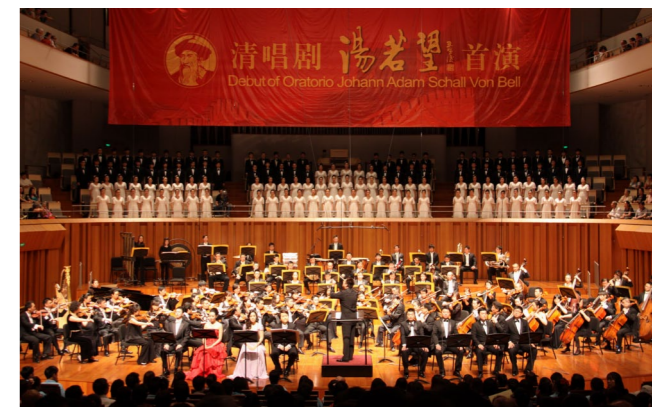
▶学院原创清唱剧《汤若望》在国家大剧院世界首演中反响热烈，在大连市第五届“新人新剧目”展演中获最高荣誉——优秀剧目奖