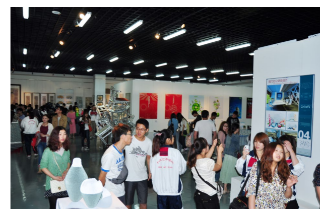
▶ 学院2012届毕业生优秀作品展