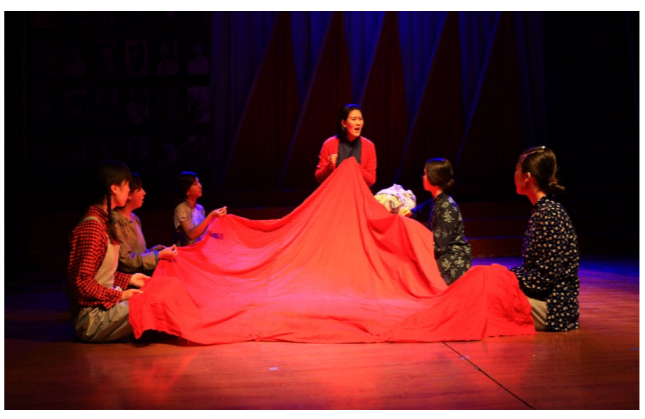
大型情景话剧《党的儿女》深入各机关、社区、学校和部队为五千余名观众演出，在辽宁省第4届大学生戏剧节上获剧目一等奖

专业主干课程：表演、台词、形体、声乐、影视综合知识、化妆、影片赏析、艺术概论、戏剧影视文学、中外戏剧史等。