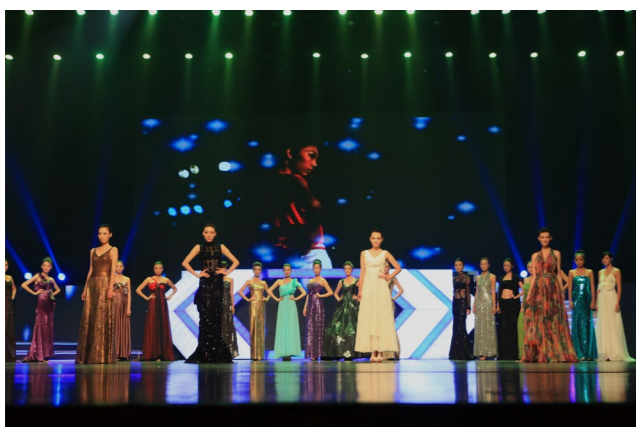
▶ 学生在第1届、第2届“全国高等院校服装类专业教学成果展示”活动中获服装设计、服装表演和化妆造型比赛15项大奖