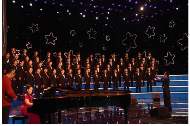
学院男声合唱团多次代表大连市、辽宁省参加全国“青歌赛”、“金钟奖”等大型比赛，并取得骄人成绩

专业主干课程：音乐与动作、合唱与指挥基础、柯达依体系的视唱练耳、弹唱、钢琴伴奏艺术、音乐教学法、音乐教育心理学基础等。