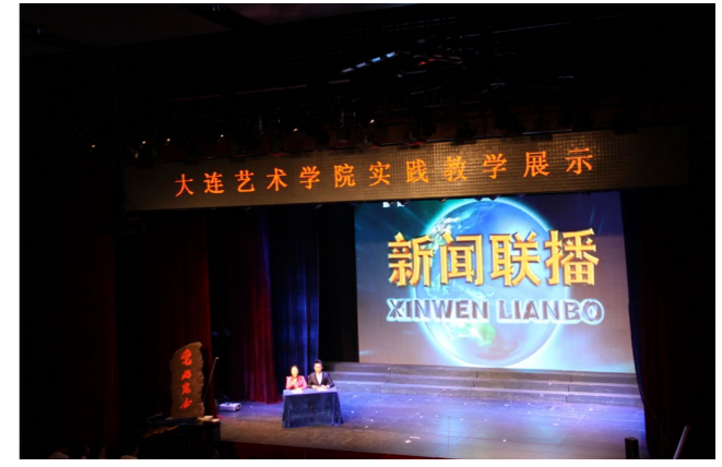
“实践教学成果展示专场”推出学院近几年打造的精品文化艺术项目