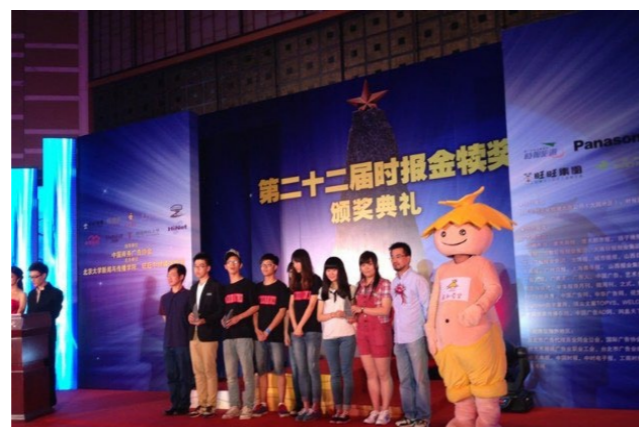
▶ 学生在全球华人地区规模最大的学生广告活动“金橙奖”比赛中获铜奖