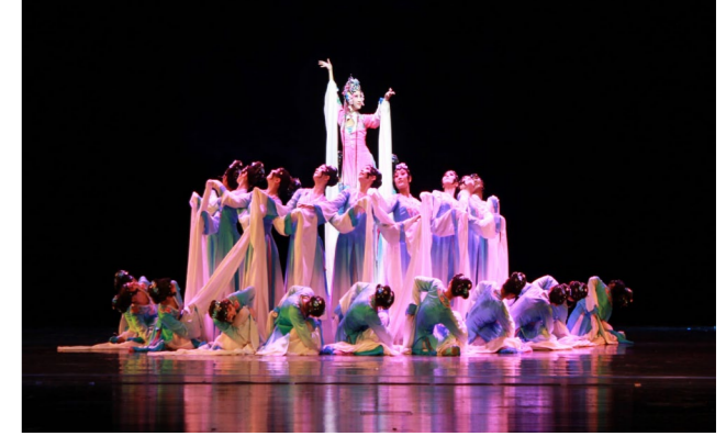
学院原创作品《戏梦人生》在第十届全国“桃李杯”舞蹈比赛中获表演二等奖和原创教学剧目二等奖，在辽宁省“荷花杯”舞蹈大赛中获金奖第一名

专业主干课程：语音发声、播音创作基础、基础日语、综合日语、日语视听说、非线性编辑、日语采访与写作实训、日语播音与主持等。