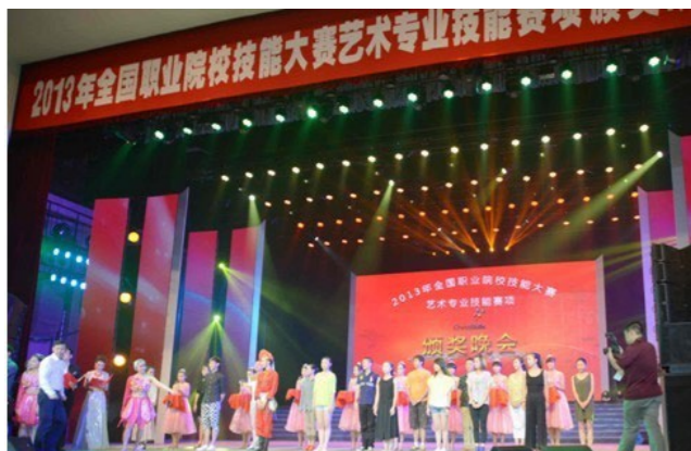
▶ 学生在“全国职业院校技能大赛艺术专业技能比赛”中以《在那遥远的地方》获得高职组“中国舞表演”一等奖