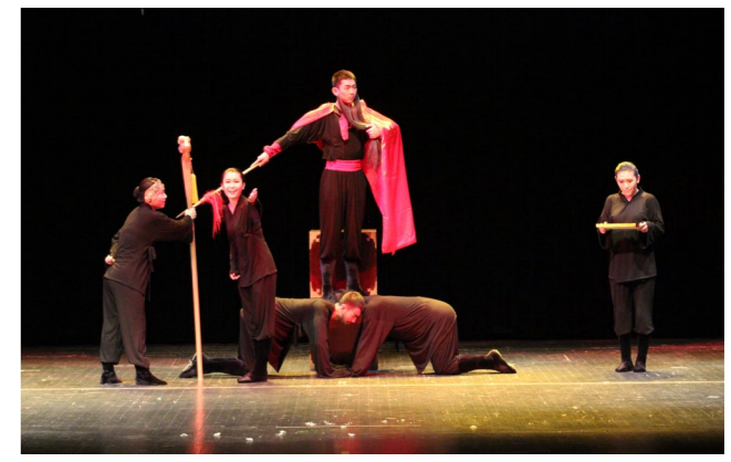
学院原创肢体话剧《杨门女将》在第三届中国校园戏剧节上获得优秀组织奖、优秀剧目奖和专业组唯一的优秀导演奖