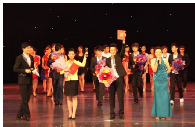
▶ 学院学生获大连市高校主持人大赛金奖