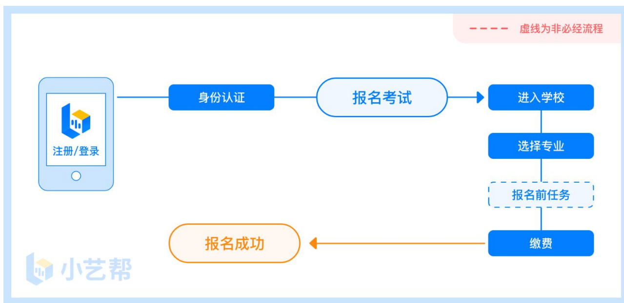
报名前及报名流程图