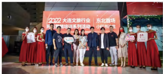
2021级学生参与策划2022大连文旅行业网络营销培训系列活动，获得大连市文化和旅游局领导和文旅企业的好评

同时旅游管理专业重视实践教学，在校内建有智慧创客生态园实践基地和旅游管理实训基地，为校内研学旅游、生态旅游，酒店实践等项目开展提供全方位支撑。在校外建有实践教学基地20余家，分别是大连凯宾斯基酒店、大连君悦酒店、沈阳方特欢乐世界有限公司、大连金石滩集团、大连发现王国主题公园、大连东北国际旅行社等。开展实践教学合作的方式包括：①企业参观；②现场教学；③聘请企业管理人员做兼职教师；④邀请行业专家开展专业讲座（报告）；⑤学生准顶岗实习、毕业实习；⑥教师顶岗实践。