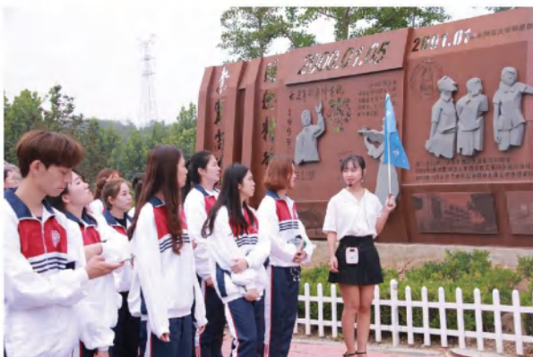
旅游协会带团进行校园讲解，体现专业特色