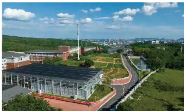
九颗槐农耕园全景