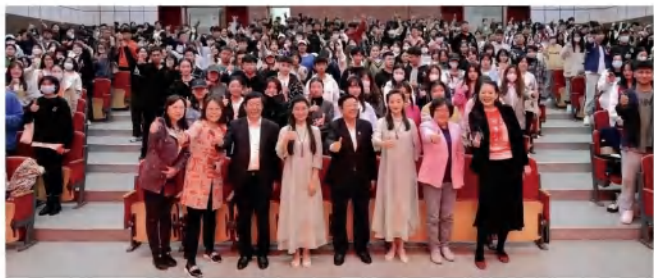
《香火相传——非遗香包文化传承与创新的引领者》荣获“互联网+”大学生创新创业大赛国赛银奖

旅游管理专业建于2011年，现有在校生900余人。专业2018年获批为校级“转型发展试点专业”；2019年获批校级OBE改革试点专业；分别于2012年和2017年获批两项辽宁省“大学生校外实践教育基地”项目；2021年，“基于产教融合、协同创新行业型旅游管理人才培养模式构建与研究”获得辽宁省高校教育教学成果二等奖；2022年，“文旅融合背景下旅游管理专业创新教育实践”获得辽宁省高校教育教学成果三等奖；2021年，《旅游类专业学生景区实习规范》修订项目获文化和旅游部科技教育司批准立项；2021年，“旅游心理学”“中国旅游文化”课程获批省级优质教学资源建设与共享课；“旅行社计调与外联实务”被评为省级课程思政典型案例；2021、2022年，“旅游景区服务与管理”“旅游市场营销”先后被评为辽宁省一流课程；2024年，《旅游职业素养与职业生涯规划》获批省级十四五规划教材。