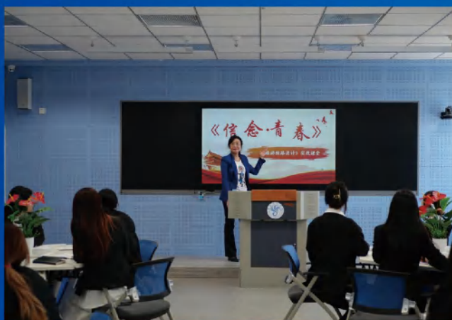
旅游管理专业省级课程思政典型案例课程《信念·青春》的课堂演绎，师生共同呈现一场生动的思政课