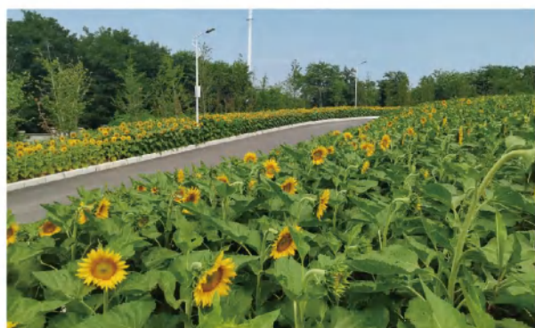
凤凰生态园向日葵花海