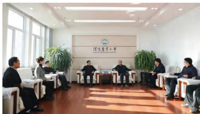
与沈阳农业大学建立友好合作关系