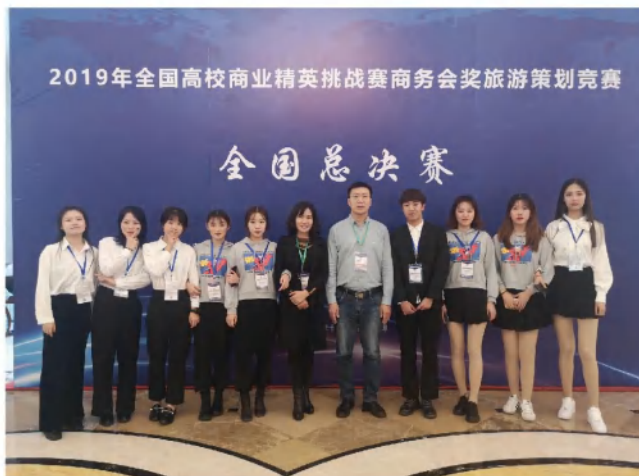
旅游管理专业师生参加全国高校商业精英挑战赛，提升学生专业创新能力