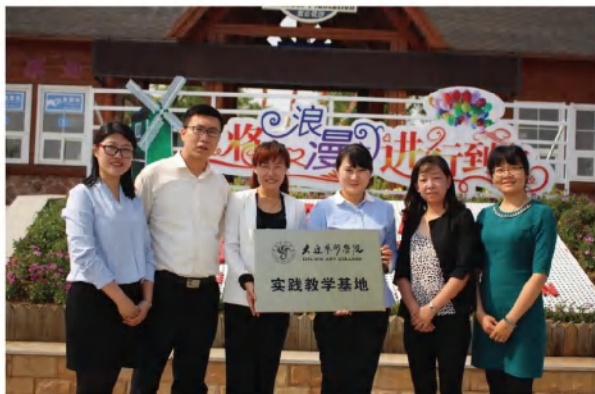
大连紫云花汐景区作为省级大学生校外实践教育基地，为学生提供实践的平台