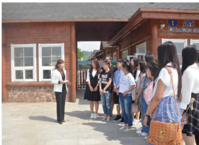
本校教师在景区实践基地为学生授课指导，学生认真聆听学习