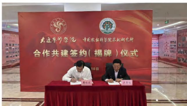
与中国农科院果树研究所签署合作单位