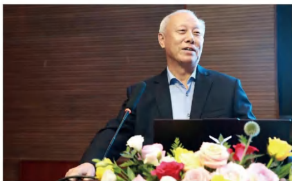
李德发院士的大师公开课