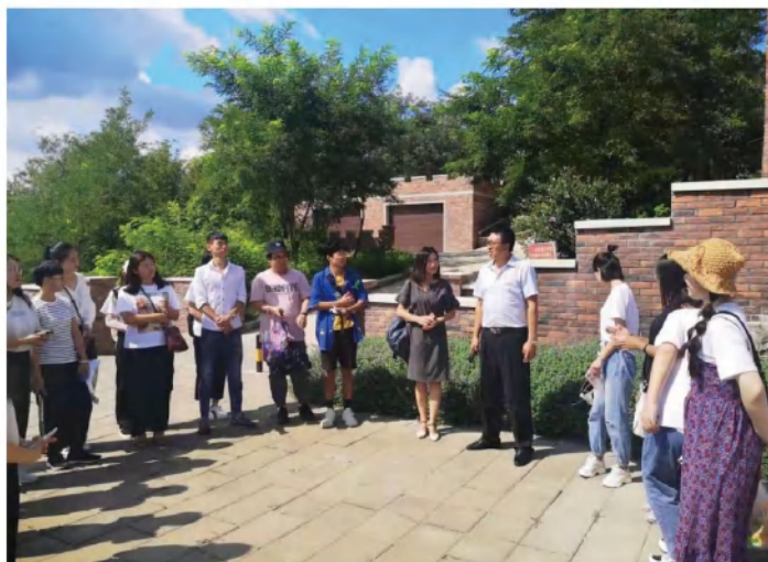
旅游管理专业师生与校外实践基地领导沟通交流，让学生更好的了解行业现状