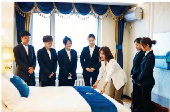
教师在校内宾馆开展实践教学活活动，学生现场观摩并实践