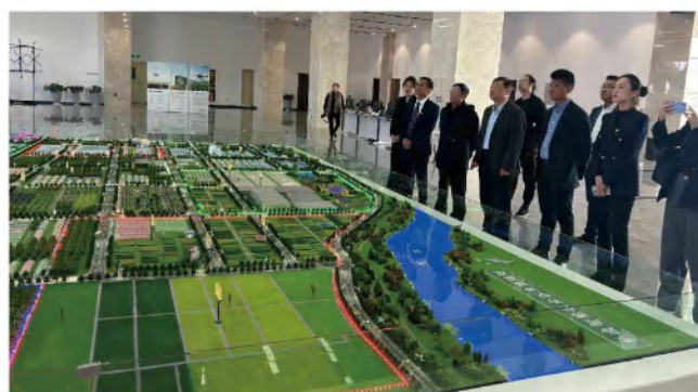
党委书记董事长与学院领导考察杨凌现代农业示范基地