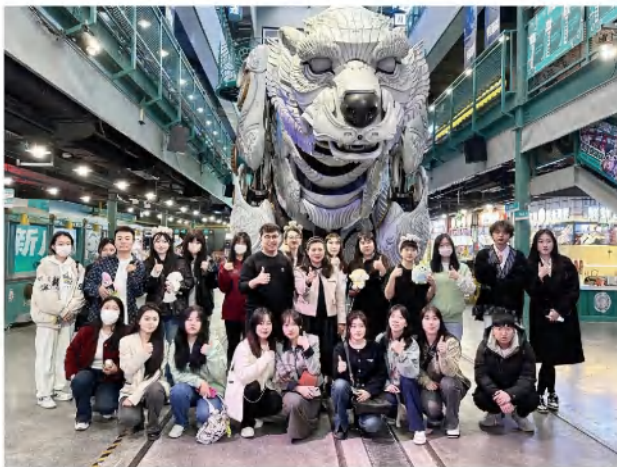
2020级学生在大连冰山慧谷熊洞街见习交流

旅游管理专业现已确立了立体化、全过程的实践教学体系和“3×4”的实践教学模式；在教学中形成了产教融合、动态调整、能力本位实践教学体系，确立了协同创新、学科交叉、才艺双馨人才培养目标，强化了校企共建、文化育人、教学做赛的创新教学特色，真正增强地方高校为区域经济社会发展服务的能力，毕业生得到社会广泛好评。