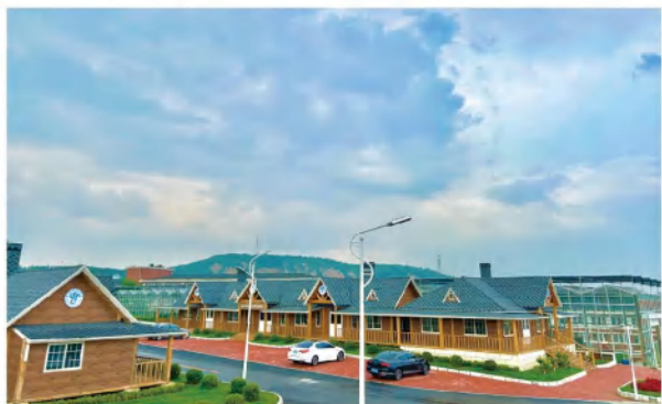
九颗槐农耕园农耕房