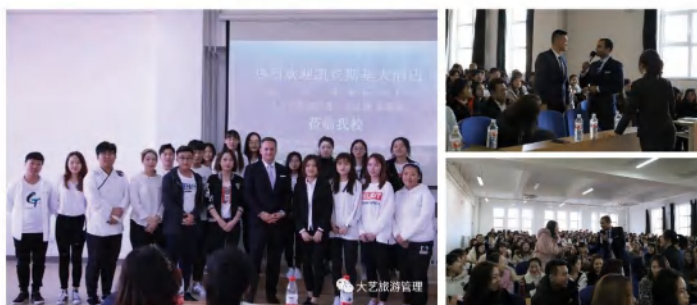
大连凯宾斯基酒店总经理、大连希尔顿酒店总经理与学生交流，让学生们对将来所从事的行业有进一步认识

学生毕业后可在文化与旅游行政管理部门、旅游集团、旅行社、旅游景区、旅游咨询公司、旅游电子商务企业、旅游规划策划机构、主题公园、旅游休闲与演艺团体等行业从事旅游资源开发、旅游项目设计、旅游市场营销、文化导游、旅游演艺等方面工作。